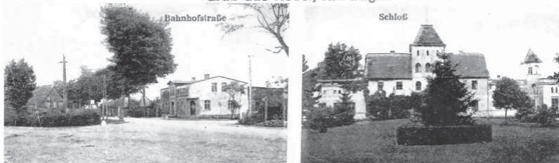
Restauracja Kruppa, później własność Augusta Dumke Ulica Dworcowa oraz zamek (pałac) - obecnie na posesji państwa Bialek.