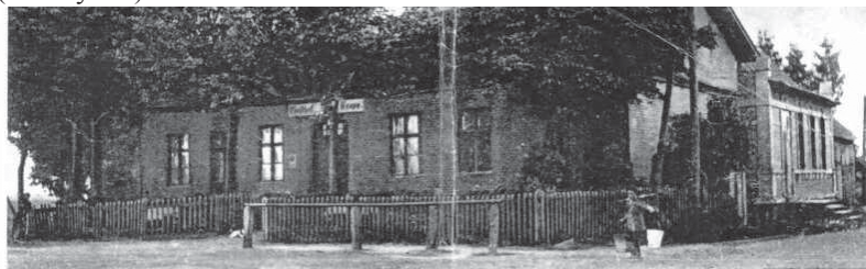
Gruß aus Redel, Krs. Belgard

- Obecnie w Redle mieszka około 1200 osób, zamieszkujących w 320 gospodarstwach domowych.