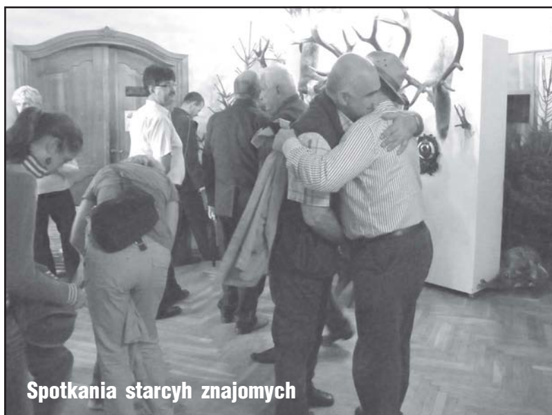
Spotkania starych znajomych