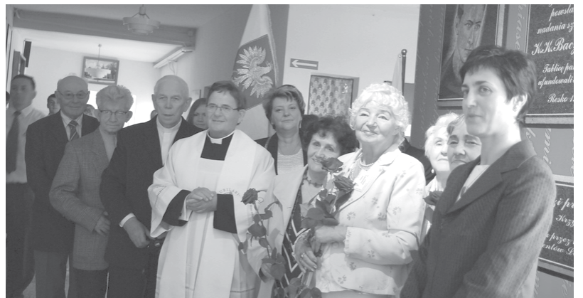
niejszych szkolnych lat trwała niemal do rana.