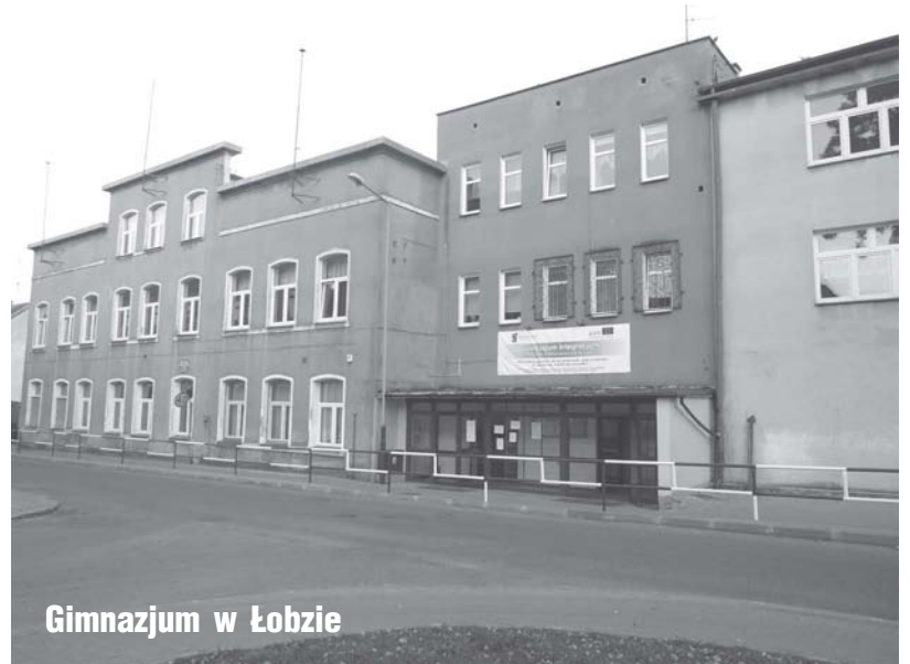
Gimnazjum w Łobzie

Wszystko zdeptane, zniszczone, potem posadził jaśmin – chciał podcinać, aby był z niego żywopłot – poniszczyli podeptali, nic nie ma. Nic do nich nie dociera. Gdyby był policjant, strażnik, czy nauczyciel... A tutaj nic. Już nie mam siły, żeby mnie tak na każdym kroku wyzywali, żeby wyzywali osobę starszą, ja wszystko strasznie przeżywam. Przy bramce do ogrodu wszystko jest obsikane, jest tam straszny smród, kiedyś mąż dał tam drut kolczasty, by nie przechodzili – drut przecięty, dalej wchodzą. Wchodzą, gruszki, jabłka poobrywane, to że oberwali to czort z tym, ale poniszczyli wszystko.