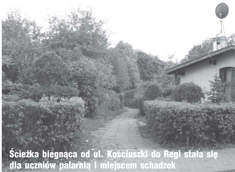
Ścieżka biegnąca od ul. Kościuszki do Regi stała się dla uczniów palarnią i miejscem schadzek

ich, jako naszych absolwentów. Potrafią przejść przez bramę, podać papierosy naszym uczniom. W tej chwili trochę się pogorszyło, bo brama jest otwarta ze względu na prace trwające na boisku. Jak woźny nie zdąży przed dzwonkiem, to jest problem, bo część uczniów „znika”. Teraz częściej wychodzimy poza szkołę, chociaż tak prawdę powiedziawszy to my nie mamy takiego obowiązku. Naszym obowiązkiem jest zajmowanie się nimi w szkole. Naszym ogromnym problemem jest sala gimnastyczna poza szkołą. Przejście uczniów do sali gimnastycznej powoduje, że idą na promenadę i zaczynają palić. Praktycznie rzecz biorąc, w drodze do sali, na każdym etapie, powinien stać nauczyciel. Czy nie może być tak, że klasa idzie do sali w grupie wraz z nauczycielem? Może, ale i tak któryś się zgubi, bo został w toalecie, bo o coś musiał się spytać pana po lekcji. W szkole jest monitoring. Na dole są pierwsze drzwi ściągnięte, by nie było kłębow dymu w toaletach. Uczniowie przychodzą tu i przysięgają, że nie będą już palić. Ale są też tacy rodzice, którzy mówią, że pozwalają dziecku palić w domu. W tym momencie mogę tylko powiedzieć, że w szkole obowiązuje zakaz palenia i do szkoły papierosów nie powinno się przynosić.