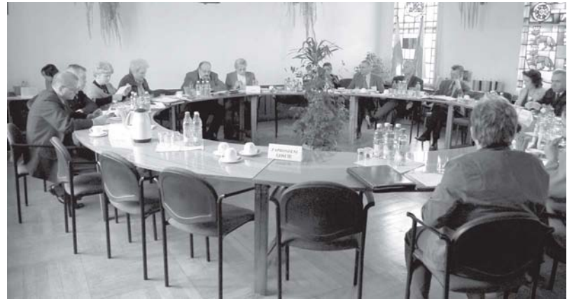
Proponowane stawki podatku w porównaniu do roku bieżącego.

- Przypadek tym rządził, że jeśli ktoś miał na terenie swojej posesji 8 arów, a 6 arów wpisane było jako VI klasa, to nie płacił w ogóle podatku, a jeśli ktoś miał taki sam teren, podobnie zagospodarowany, na tej samej ulicy a miał wpisane „Ba”, to płacił 25 groszy za metr kwadratowy. Czy nadal tak jest? Czy może każdy płaci 25 gr za każdy metr? Powinno się płacić od zajmowanego gruntu, a nie, że ktoś ma trzy grządki i płaci jak za warzywa. Jeśli jest to grunt na polepszenie warunków, za który płaci się jak za grunt rolny, to jest to nieoficjalnie, bo inni płacą za cały swój teren wyższe podatki. Jeśli płacilibyśmy jedną stawkę, to budżet gminy byłby za-