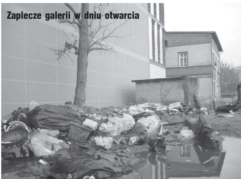
Zaplecze galerii w dniu otwarcia