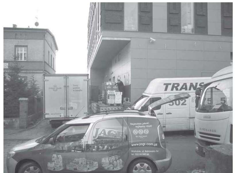
Wokół rampy załadowniczej