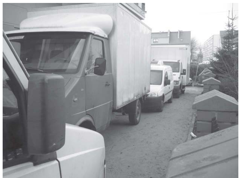
Zatarasowany dostawami dojazd do posesji i garaży prywatnych