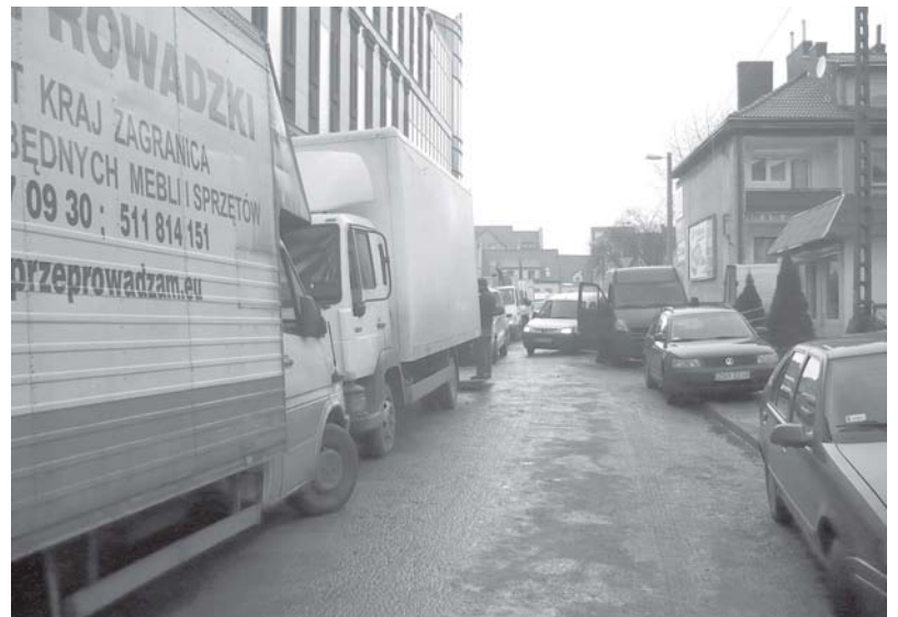
Ul. Bracka od strony rz. Regi