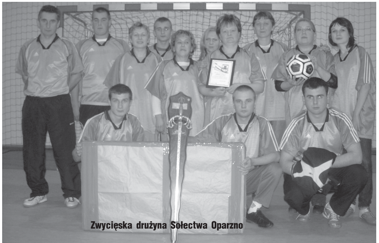
Zwycięska drużyna Sołectwa Oparzno

Nagrody ufundowane przez Gminę Świdwin wręczył zastępca wójta Gminy Zdzisław Pawelec.