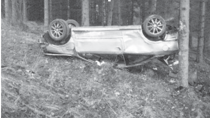
(OSIEK) 25-letnia pijana kobieta straciła panowanie nad pojazdem i wpadła do rowu. Wraz z pasażerką trafiła do szpitala.