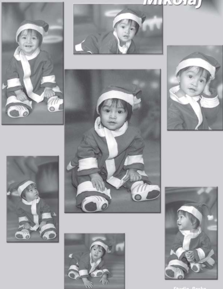
Studio - Resko