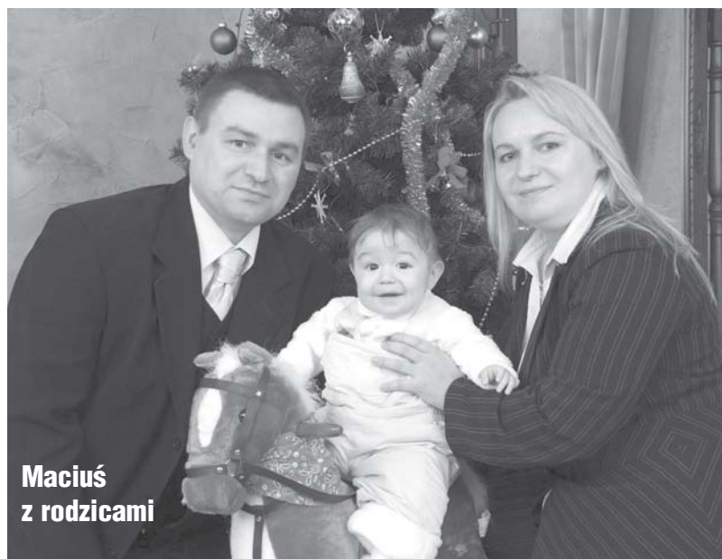
Maciuś z rodzicami