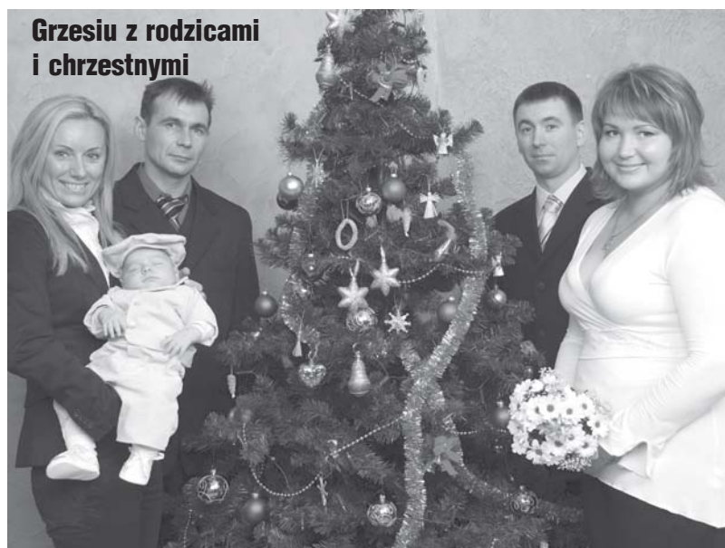
Grzesiu z rodzicami i chrzestnymi