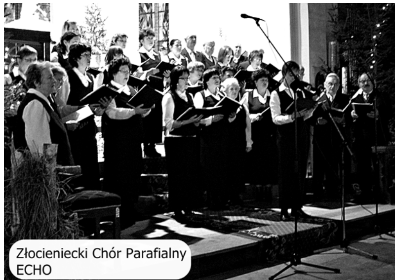
Złocieniecki Chór Parafialny ECHO