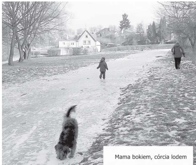
Mama bokiem, córka lodem

nach jest solidne zagospodarowanie terenu, pierwsze prace już się rozpoczęły, ale o końcu zamierzenia nawet nie ma co wspominać. Przestrzegamy tylko – na razie lepiej omijać te alejki, bo pod lodem. (N)