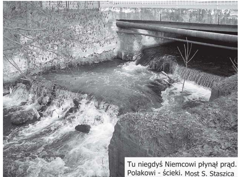
Tu niegdyś Niemcowi płynął prąd. Polakowi - ścieki. Most S. Staszica

Kudy tam do Złocieńca pod względem darów natury Drawsku Pomorskiemu, Kaliszowi, nawet Czaplinkowi, gdyby nie jezioro. Przykład pierwszy z brzegu. Most Stanisława Staszica. Kaskada wodna, burzliwe odgłosy żywiołu, za-