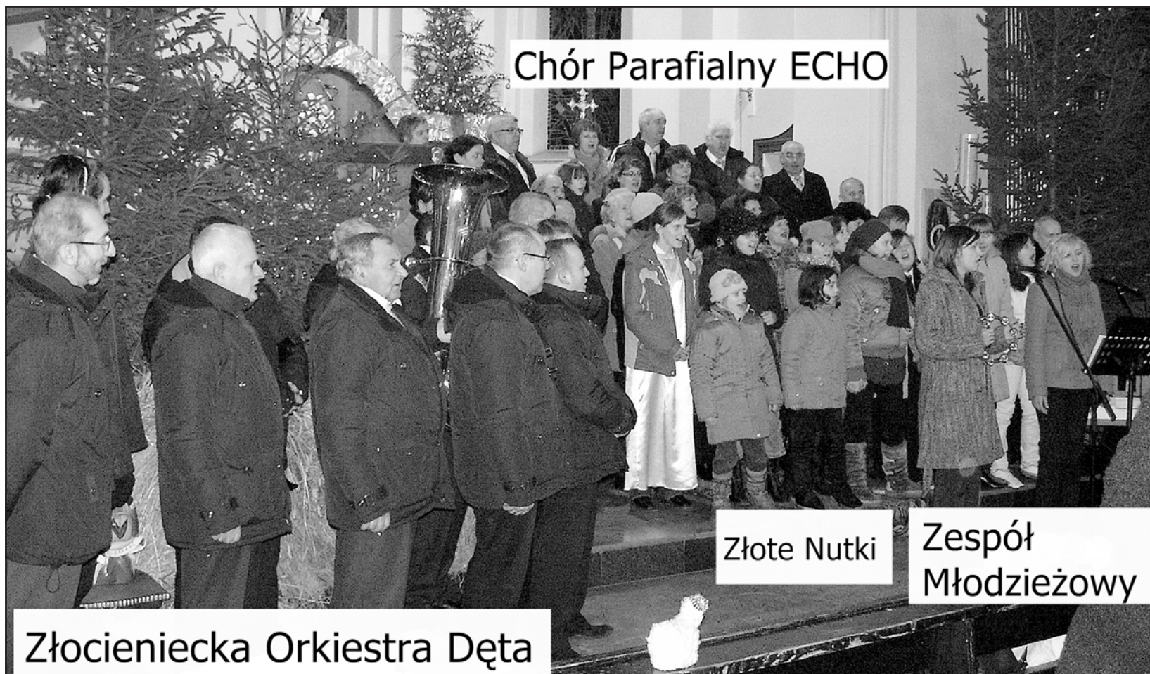
Chór Parafialny ECHO