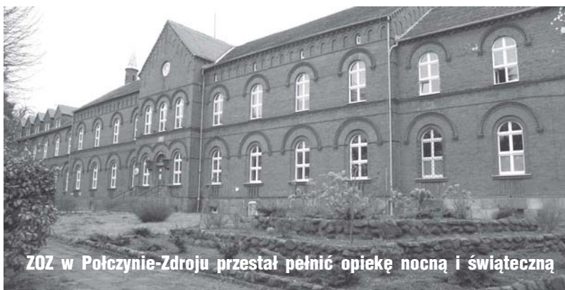
ZOZ w Polczynie-Zdroju przestał pełnić opiekę nocną i świąteczną