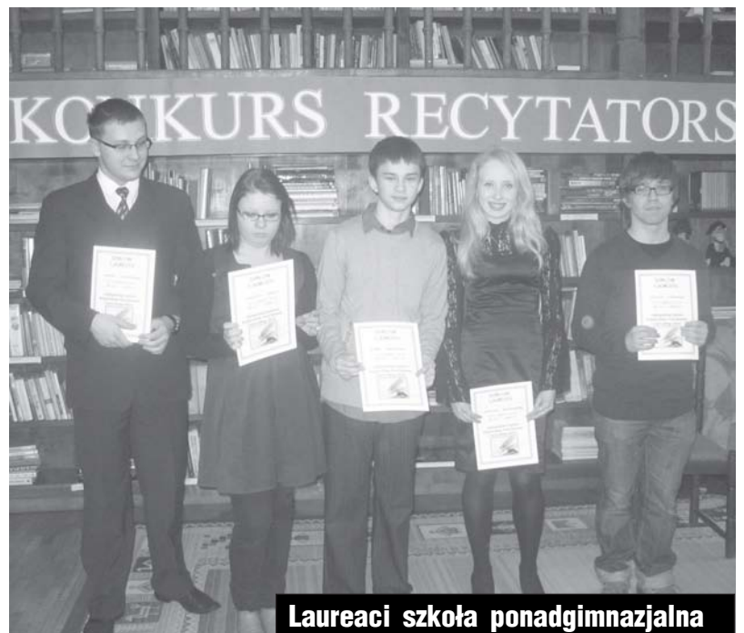
Laureaci szkoła ponadgimnazjalna

Jury będzie obradowało podczas otwartej dla wszystkich „Biesiady Bab”, która odbędzie się 17 kwietnia (piątek) o godzinie 12.00 w trzebiatowskim Pałacu.