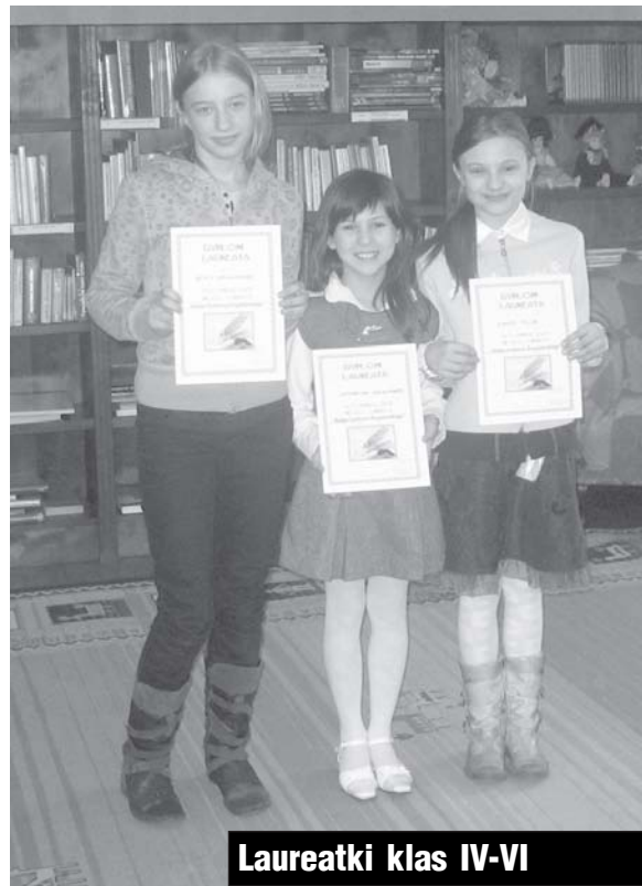
Laureatki klas IV-VI