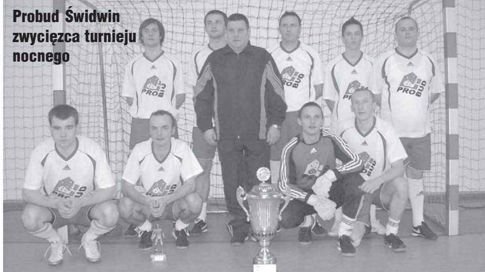
Probud Świdwin zwycięzca turnieju nocnego