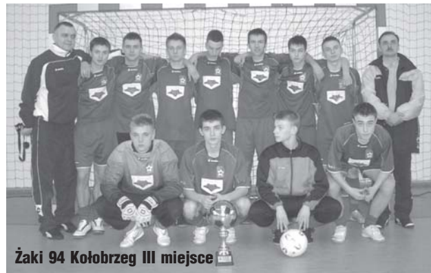
Żaki 94 Kołobrzeg III miejsce