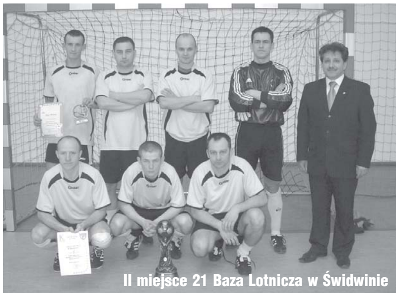
II miejsce 21 Baza Lotnicza w Świdwinie