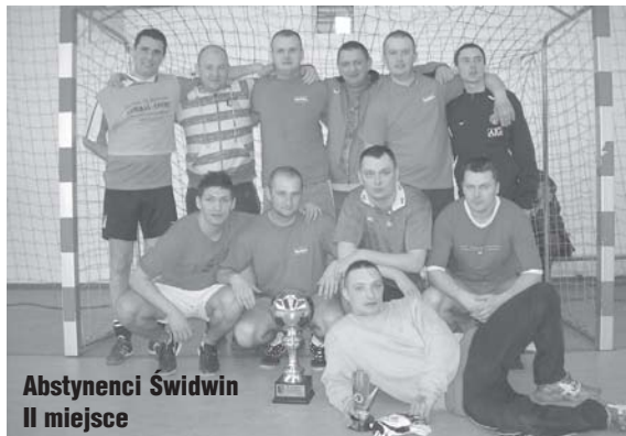
Abstynenci Świdwin II miejsce

Turniej rozegrany został w dwóch grupach eliminacyjnych (czas gry 1 x 15 minut).