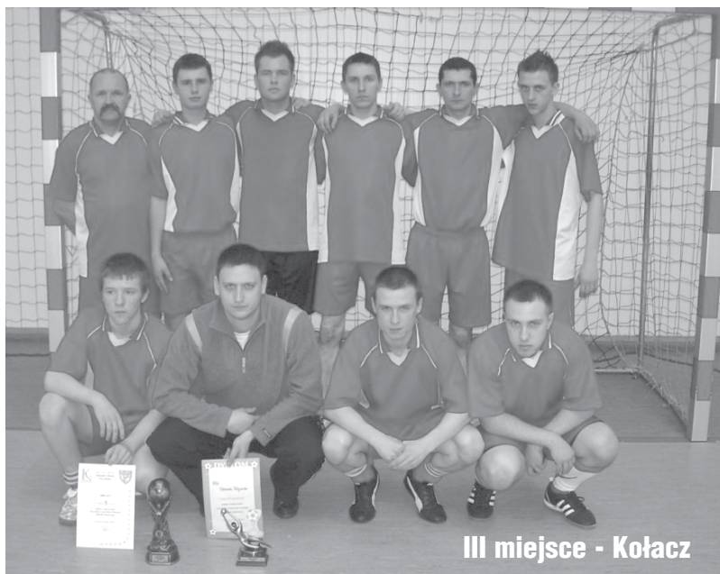
III miejsce - Kołacz