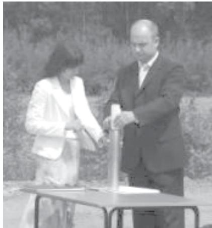
Wardyn Górnym (gm. Połczyn - Zdrój), 22.06.2006 r., uroczystość wmurowania kamienia węgielnego pod budowę MPGO.

(POWIAT) Już od dłuższego czasu Międzygminne Przedsiębiorstwo Gospodarki Odpadami w Wardyniu Górnym przeżywa kłopoty finansowe. Temat pojawia się co jakiś czas na posiedzeniach Zarządu Powiatu i sesjach rad gmin. Jednak nikt nie kwapi się, by go definitywnie rozwiązać. Ostatnio zajął się tematem Zarząd Powiatu, który zajął stanowisko, by sprzedać udziały i wycofać się ze spółki. A miało być tak pięknie...