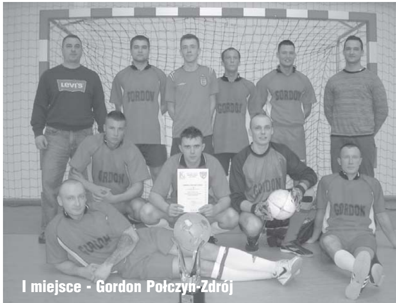
I miejsce - Gordon Połczyn-Zdrój