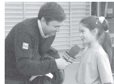
Pierwszy sportowy wywiad