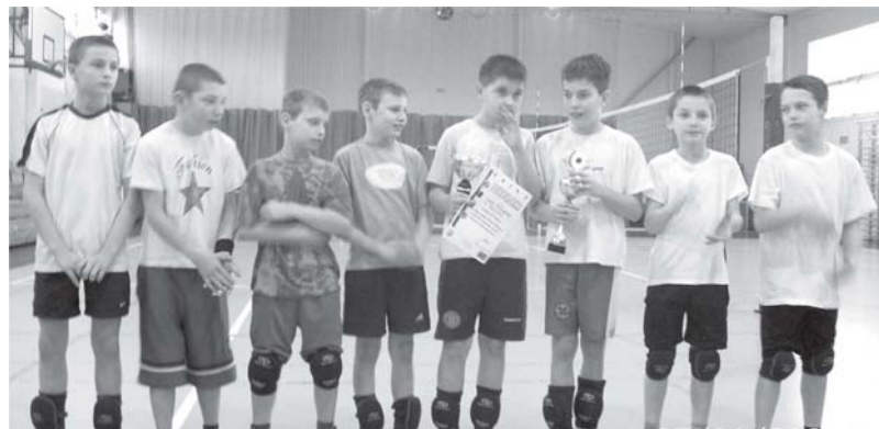
SP Belczna – najlepsi w mini siatkówce w powiecie łobeskim

(ŁOBEZ) W dniu 4 marca br. w hali sportowo-widowiskowej w Lobzie rozegrano Mistrzostwa Regionu w Mini Siatkówce Szkół Podstawowych.