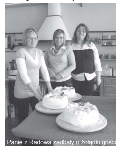
Panie z Radowa zadbały o żołądki gości