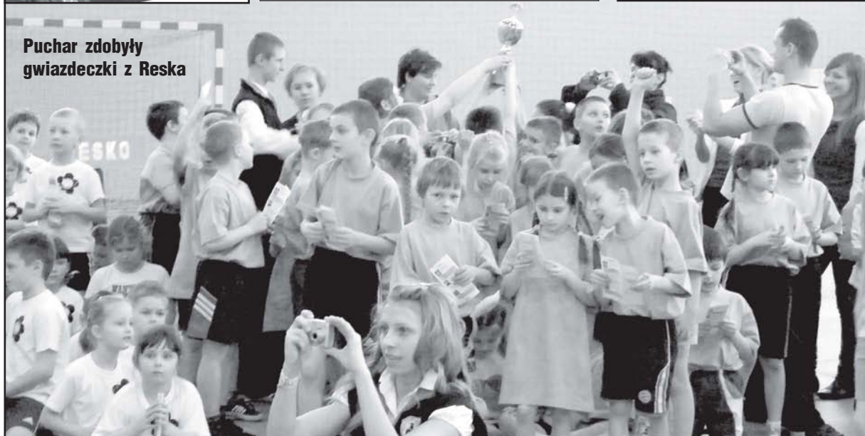
Puchar zdobyły gwiazdeczki z Reska