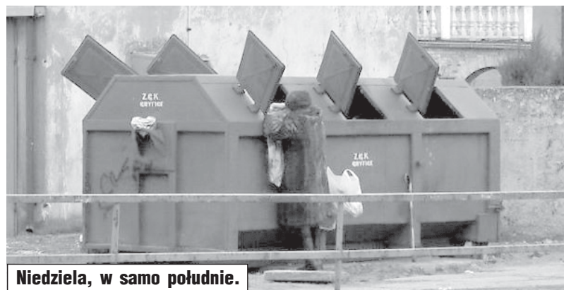
Niedziela, w samo południe.

Wszystko byłoby pięknie, gdyby nie wystąpienie gościa z IPN ze Szczecina. To, co wygłosił, to było czyste szkolenie polityczne okresu stalinowskiego. Dlaczego dzieli pisarzy na słusznych i tych słusznych inaczej, dlaczego sieje nienawiść do jednych, a gloryfikuje innych? Aby oceniać postępowanie