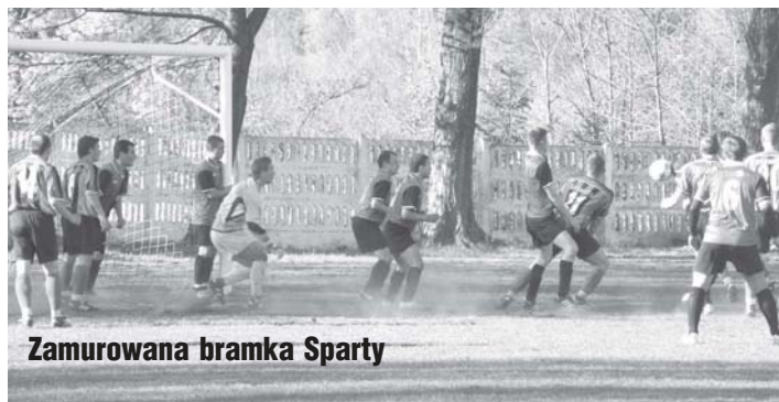
Zamurowana bramka Sparty

własną bramką przede wszystkim nie chcąc stracić bramki. Myślę, że przyjeżdżając do Dobrej liczyli na remis z liderem, ale w tym dniu to właśnie im sprzyjało szczęście.