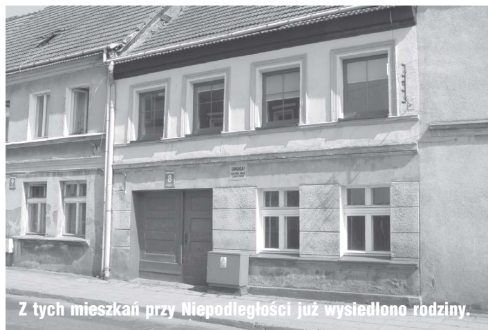
Z tych mieszkań przy Niepodległości już wysiedlono rodziny.

Mieszkańcy Niekładzia też są bezsilni wobec dramatu. Wspólnie