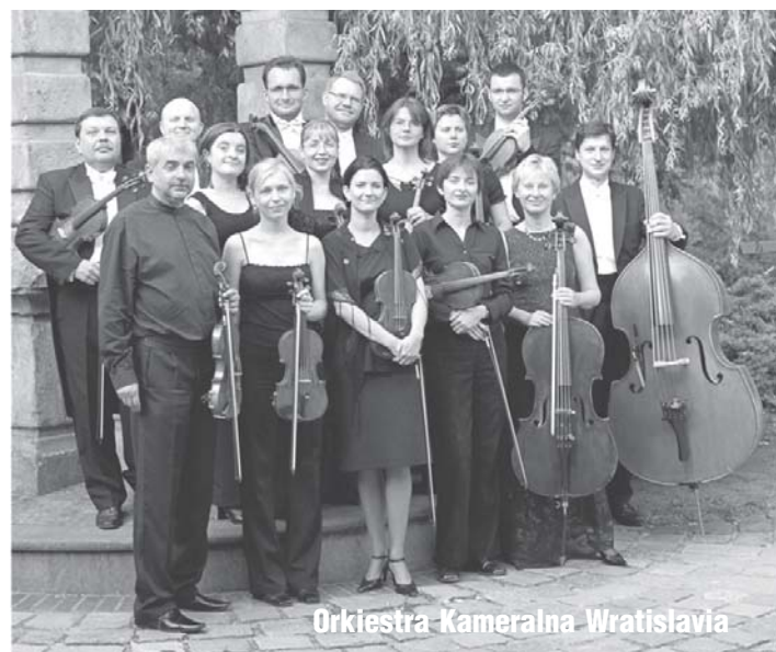
Orkiestra Kameralna Wratislavia

(XII edycja Gmina Rewal) 11 - 13 czerwca 2009