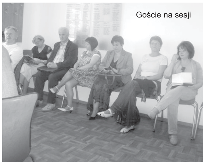
Goście na sesji