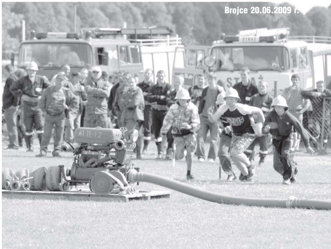
Brojce 20.06.2009 r.