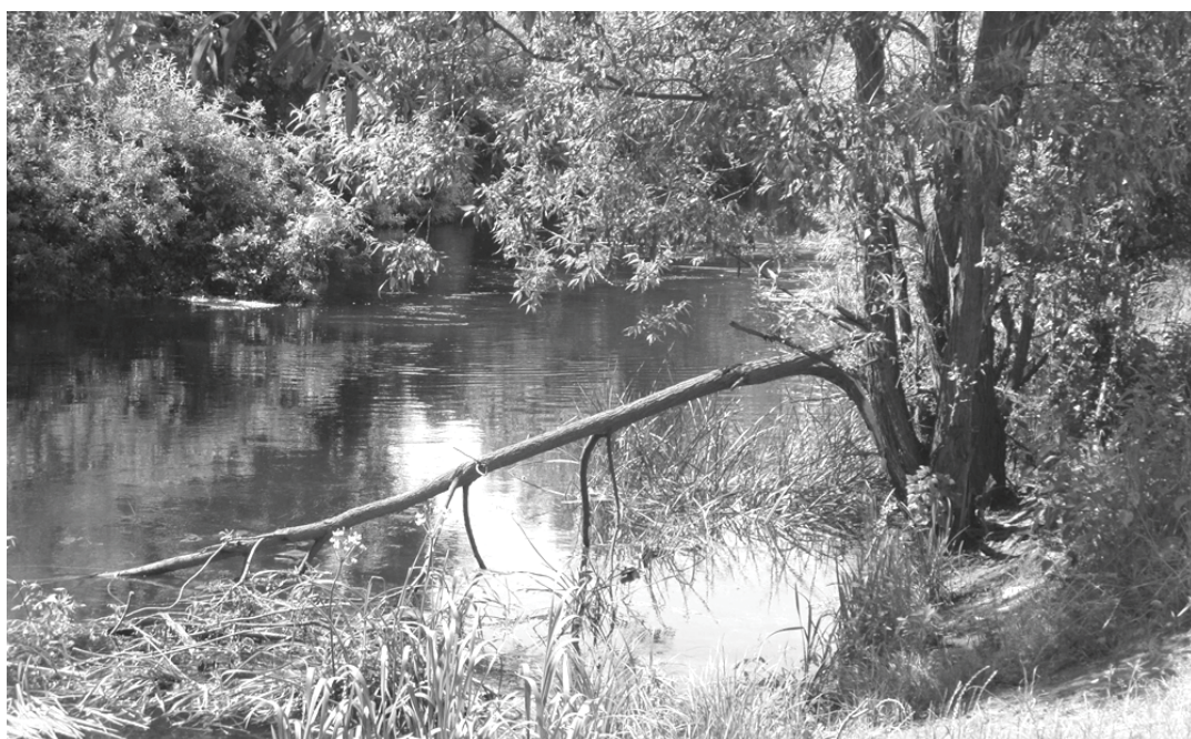
Na zdjęciu: konarek, którego też nie ma kto usunąć, choć zwisa nad kanałem gryfickiej elektrowni wodnej.

W Gryficach jest przystań i są kajaki, ale rzeka zawałona wiatrolomami jest trudna do pokonania, a nie zawsze można wziąć kajak na bary i przenieść go w inne miejsce, bo też nie wszędzie brzeg Regi jest dostępny. Dlatego przed planowaną inwestycją należy w końcu ustalić, kto formalnie odpowiada za czystość i drożność rzeki i zmusić go do usunięcia zwalonych do niej drzew. W tej chwili silny 16-latek nie jest w stanie przepłynąć w górę rzeki dalej niż 300 m, za mostek przy ul. Zdrojowej. m