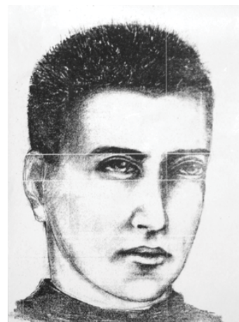
Policja zapewnia anonimowość. Mł. asp. Edyta Klepczyńska

Jeżeli ktokolwiek posiada informacje na temat osoby, która przedstawiona jest na portrecie pamięciowym, proszony jest o kontakt z Komendą Powiatową Policji w Gryficach, przy ul. Mickiewicza 19, osobiście lub telefonicznie: 0-91 38 57 511 lub Komisarzatem Policji w Rewalu: 0-91 38 57578. Informacje można zgłaszać także w najbliższej jednostce Policji pod numerem 997.