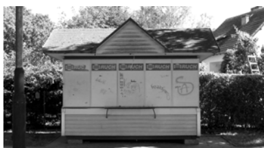
Kiosk przy ul. Woj. Polskiego

pracowników. Problem polega na tym, że tam tak można, ale kto przyjedzie do Łobza za pracą? Jednak ci co pojechali i zarobili, musieli gdzieś ulokować oszczędności. Kupowali więc nieruchomości i wynajmowali. Być może to jedna z przyczyn podaży lokali na naszym rynku. Byłby on zrównoważony, gdyby wraz ze wzrostem tej podaży szedł wzrost ilości firm, które by je wynajmowały. Tak jednak się nie dzieje. Chociaż powinno, gdyż – jak podaje Powiatowy Urząd Pracy – w ostatnich trzech latach PUP udzielił bezrobotnym aż 326 bezzwrotnych dotacji na założenie firmy w całym powiecie, z czego 190 w gminie Łobez (w tym 50 tylko w tym półroczu). Wynikałoby z tego, że rynek dynamicznie rozwija się, ale dlaczego w takim razie wzrasta ilość pustostanów? Czyż to nie swoisty paradoks?