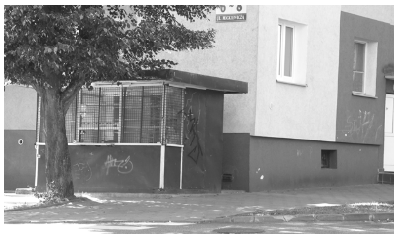
Zamknięty kiosk przy ul. Mickiewicza