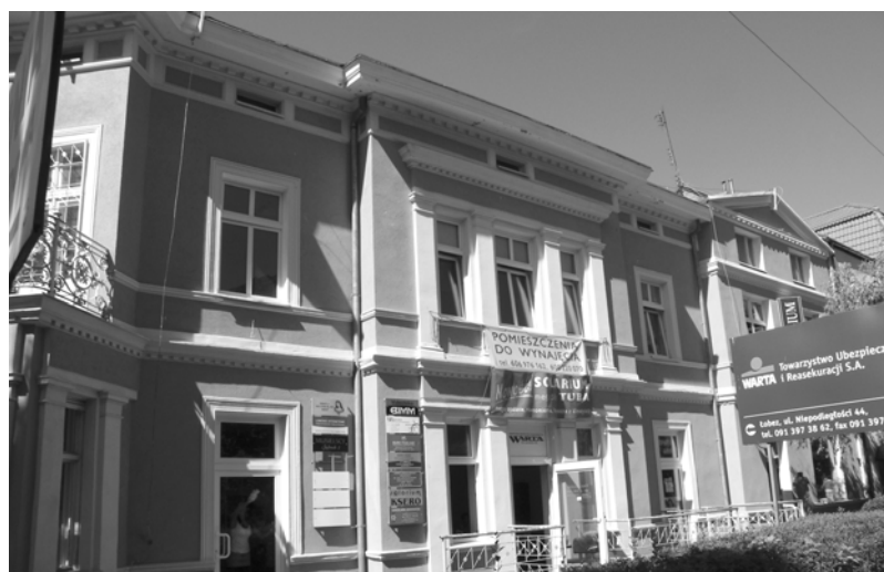
U góry: lokale do wynajęcia przy ul. Niepodległości; poniżej: lokal do wynajęcia po sklepie IDA przy ul. Kościelnej.