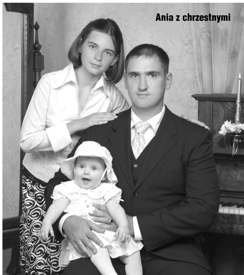
Ania z chrzestnymi