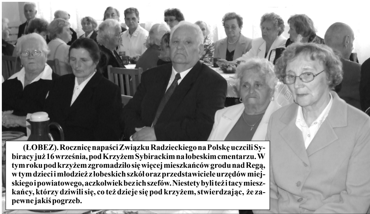
(ŁOBEZ). Rocznicę napaści Związku Radzieckiego na Polskę uczcili Sybiracy już 16 września, pod Krzyżem Sybirackim na łobeskim cmentarzu. W tym roku pod krzyżem zgromadziło się więcej mieszkańców grodu nad Regą, w tym dzieci i młodzież z łobeskich szkół oraz przedstawiciele urzędów miejskiego i powiatowego, aczkolwiek bez ich szefów. Niestety byli też i tacy mieszkańcy, którzy dziwili się, co też dzieje się pod krzyżem, stwierdzając, że zapewne jakiś pogrzeb.