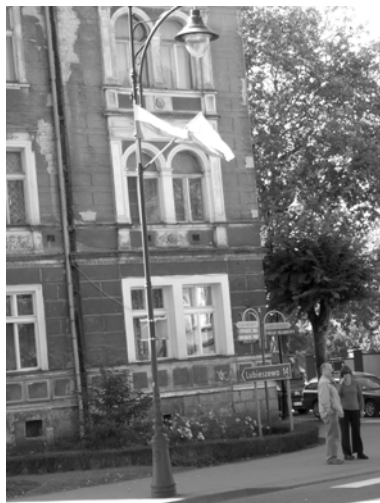
17 września w Drawsku Pomorskim powieszono flagi. Niektórzy czekali na to 70 lat.

W telewizji prezydent Rosji Miedwiediew mówi już o Izraelu jako przyjaciołach, z którymi zawarł jakieś przymierze. W „Rzeczpospolitej” z dn. 16 września rosyjski polito-