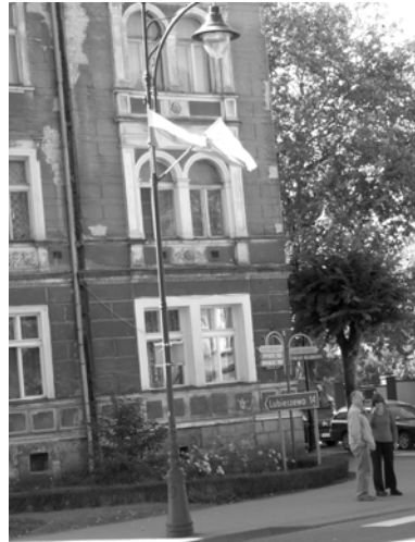
17 września w Drawsku Pomorskim powieszono flagi. Niektórzy czekali na to 70 lat.

W telewizji prezydent Rosji Miedwiediew mówi już o Izraelu jako przyjaciołach, z którymi zawarł jakiś przymierze. W „Rzeczpospolitej”