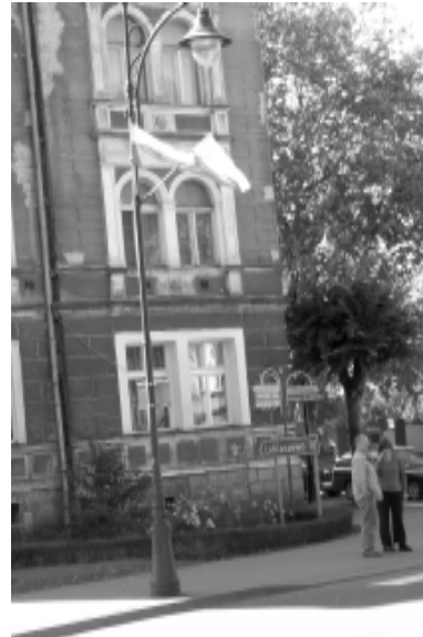
17 września w Drawsku Pomorskim powieszono flagi. Niektórzy czekali na to 70 lat.