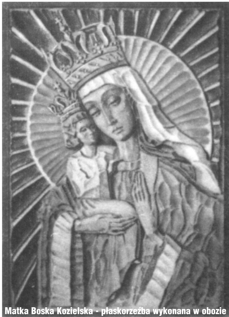
Matka Boska Kozielska - płaskorzeźba wykonana w obozie