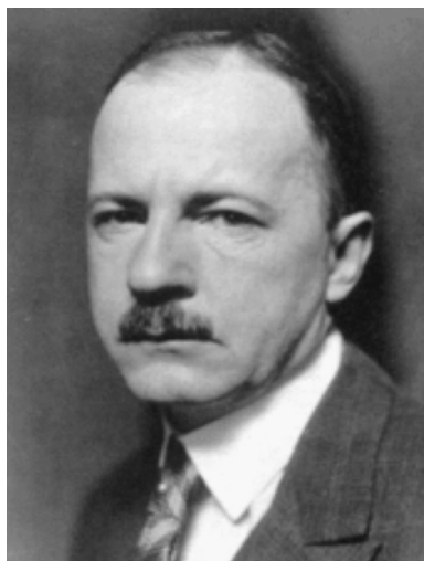
Ewald von Kleist-Schmenzin 22 III 1890-9 IV 1945