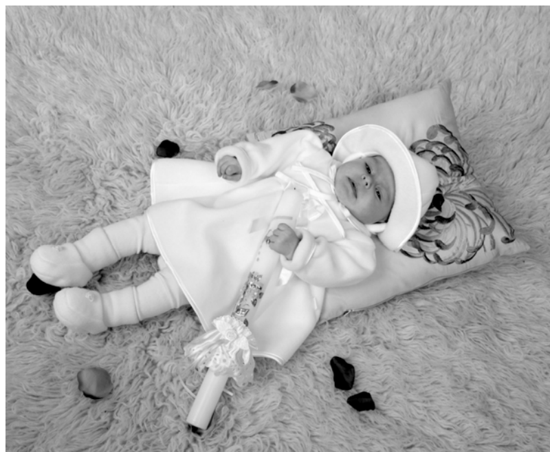
Foto-Video "Krzyś" s.c. w Łobzie Renata i Marek Pyrczak tel. 091/3974184

Prenumerata do odbioru w redakcji ul. Słowackiego 6 Łobez.