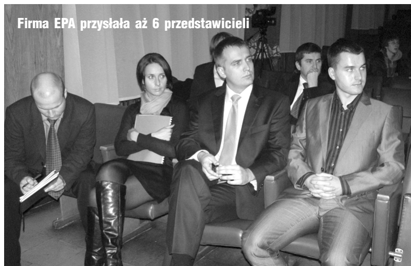
Firma EPA przysłała aż 6 przedstawicieli

inwestycyjnym. To nie burmistrz jest winien, że rozpoczyna procedurę planistyczną. To nie jest winna rada, że ten temat podjęła. W przepisach jest określone, że na wniosek inwestora burmistrz ma obowiązek rozpocząć procedurę planistyczną, czyli rozpocząć zmiany w planie zagospo-