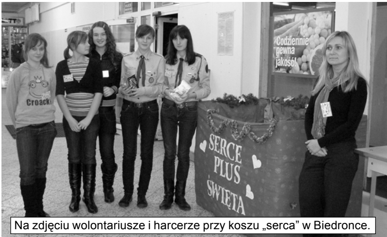
Na zdjęciu wolontariusze i harcerze przy koszu „serca” w Biedronce.

W miniony piątek rozpoczęła się akcja zbierania produktów żywnościowych, na paczki świąteczne dla rodzin wielodzietnych i kolację wigilijną dla osób samotnych. Produkty zbierane są w trzech marketach, do koszy pod nadzorem wolontariuszy i harcerzy, którzy zachęcają klientów jak najlepiej potrafią do dzielenia się dobrem. Z krótkiej obserwacji wynika, że ludzie reagują pozytywnie na jedenastą już edycję tej akcji. m