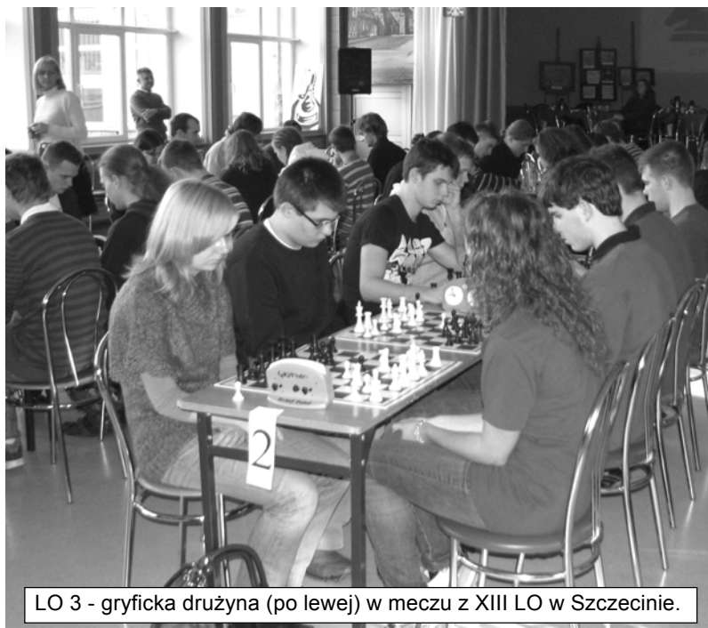
LO 3 - gryficka drużyna (po lewej) w meczu z XIII LO w Szczecinie.

To nie była równa walka. Koszalin przyjechał w składzie: Wicemistrz