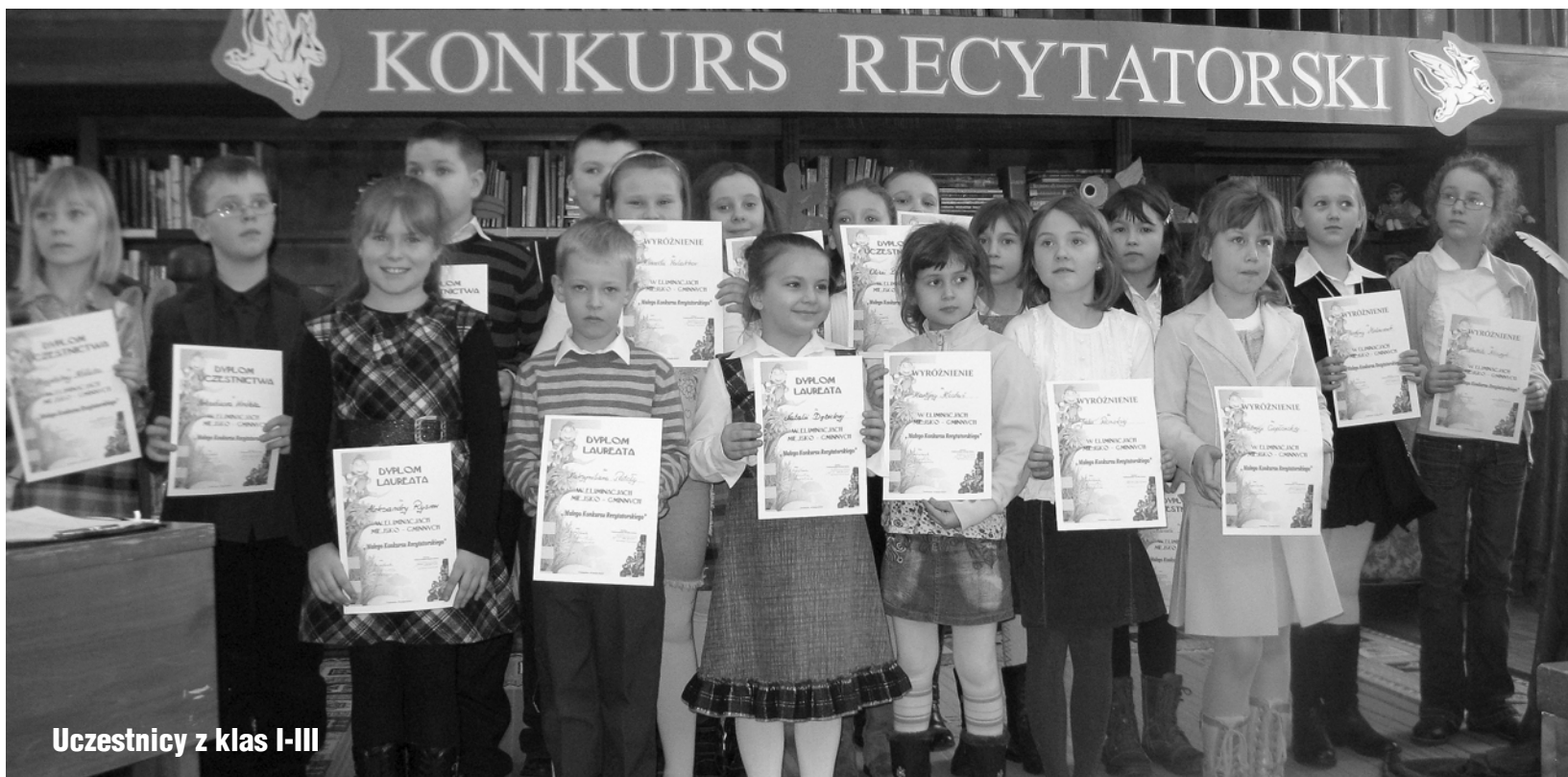
Uczestnicy z klas I-III