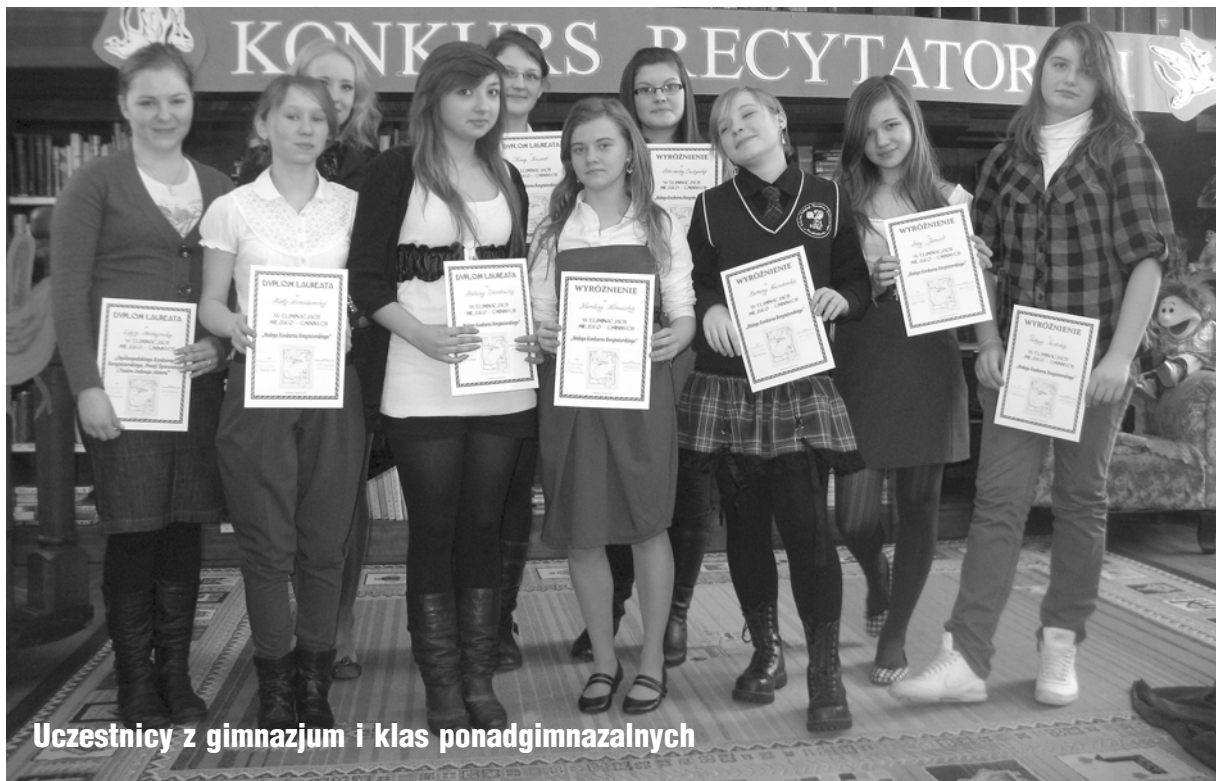
Uczestnicy z gimnazjum i klas ponadgimnazjalnych

Szkoła Podstawowa klasy I-III Laureaci (wezmą udział w elimi-