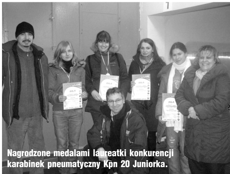
Nagrodzone medalami laureatki konkurencji karabinek pneumatyczny Kpn 20 Juniorka.

W pięknej zimowej atmosferze w miesiącu lutym Zarząd Rejonowy LOK Gryfice Młodzieżowy Mlub Strzelecki LOK, Baszta Gryfice wraz z Sekcją Strzelecko-Ratunkową Szkolnego Koła PCK przy LO im. B. Chrobrego przeprowadzili zawody strzeleckie „ZIMAZLOK” na strzelnicy sportowej w Gryficach.