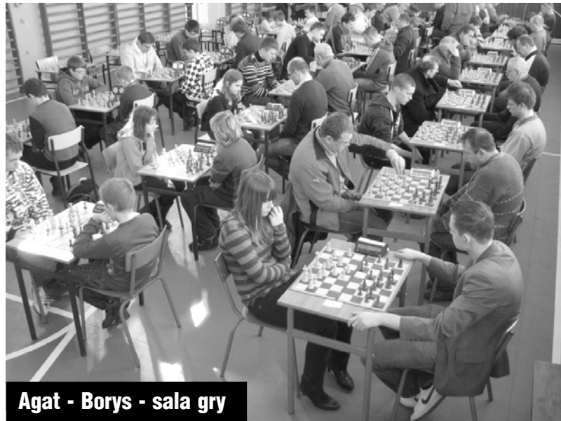
Agat - Borys - sala gry

Już po raz 8., na przełomie lutego i marca, w Gryficach jest rozgrywany turniej szachów szybkich, inaugurujący cykl zawodów Grand Prix Wybrzeża. W tym roku, do Gryfic, na ten prestiżowy turniej, przyjechało 58 szachistów z niemal całego województwa. Nie padł wprawdzie rekord frekwencji (w zeszłym roku grały aż 82. osoby), ale z uwagi na konkurencyjny turniej w Koszalinie, frekwencję trzeba uznać za bardzo dobrą.