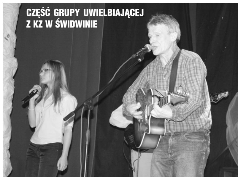
CZĘŚĆ GRUPY UWIELBIAJĄCEJ Z KZ W ŚWIDWINIE