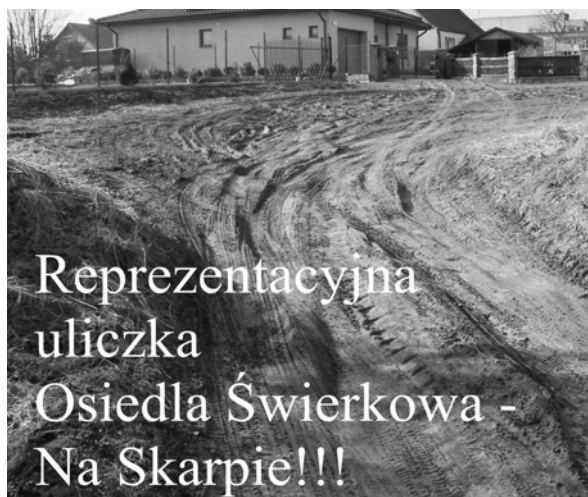
Reprezentacyjna uliczka Osiedla Świerkowa - Na Skarpie!!!