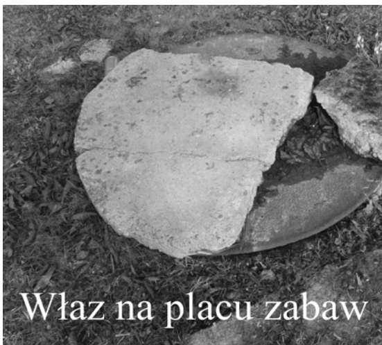
Właz na placu zabaw

No i już jesteśmy pod byłą cegielnią Zamkowa. Na jej dziedzińcu