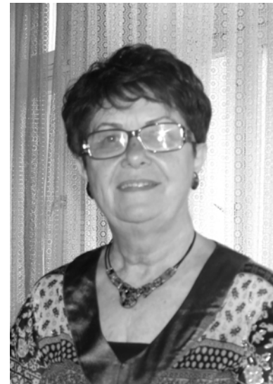
ście dostosowane do naszego wieku.

Ostatnie spotkanie miało miejsce 29 marca. Podjęłyśmy decyzję o przystąpieniu do ogólnopolskiej akcji charytatywno-ekologicznej. Oprócz tego miałyśmy trening umysłowy, w postaci zabaw w odgadywanie haseł mimicznych. Mamy koleżankę, która podczas spotkań umiła nam czas grą na pianinie. Wszystko co robimy, jest oczywi-