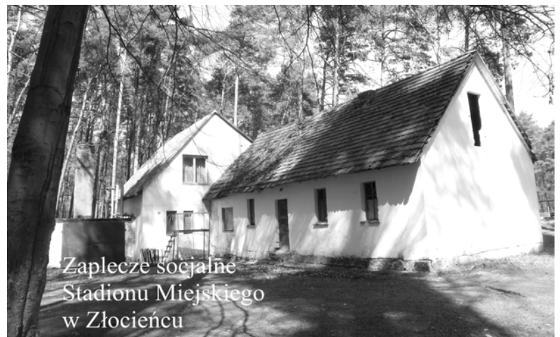
Zaplecze socjalne Stadionu Miejskiego w Złocieniu