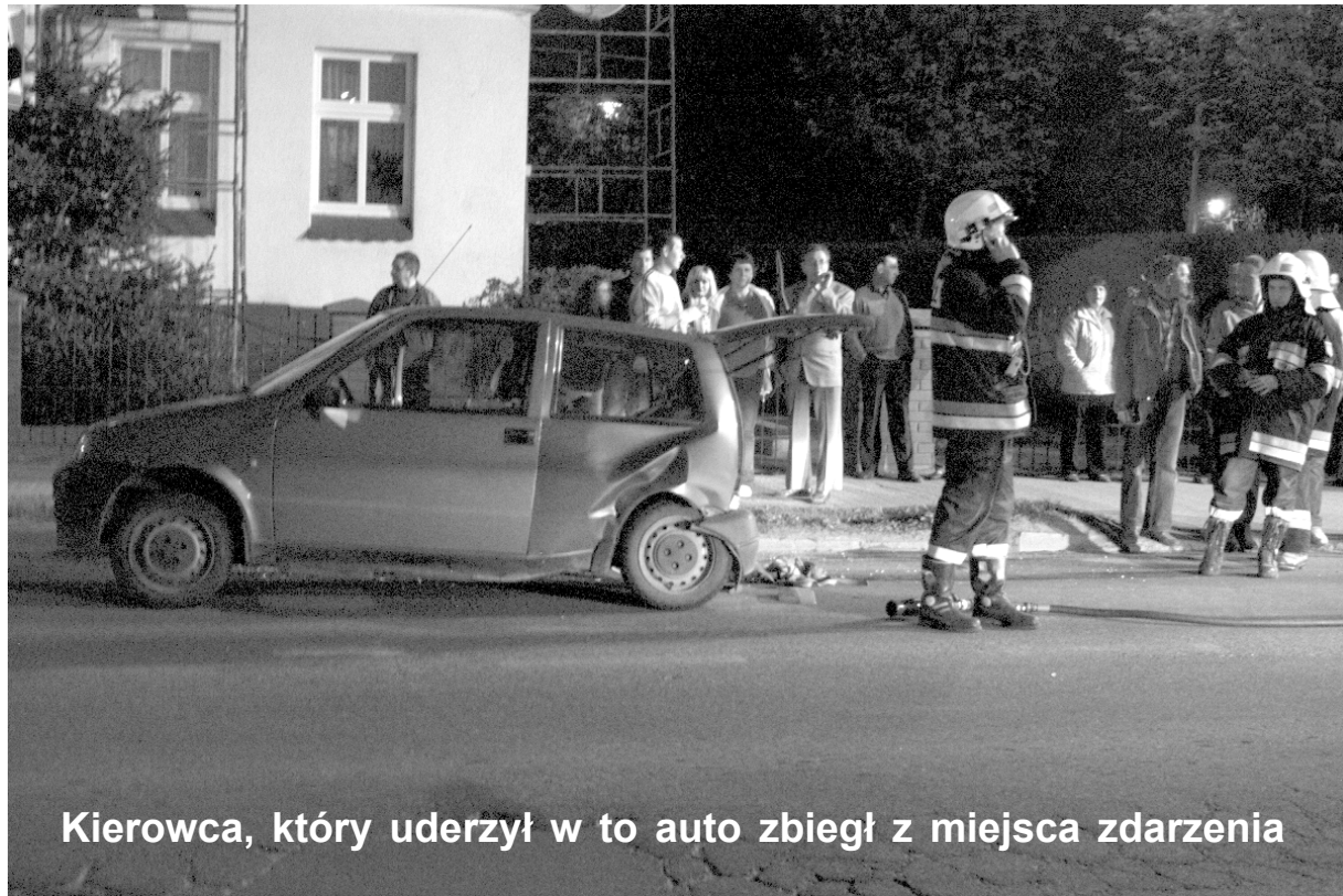
Kierowca, który uderzył w to auto zbiegł z miejsca zdarzenia

W sobotę przy ul. Czaplneckiej w Złocieniu również doszło do wypadku. Tygodnik był na miejscu tego wydarzenia chwilę po tym, jak