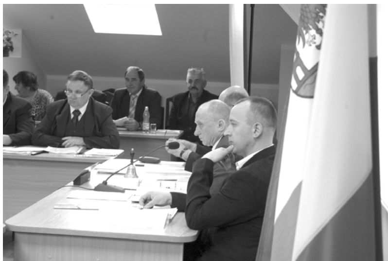
Przewodniczący i radni w skupieniu słuchają sprawozdania skarbnik.

Po prezentacji filmów nadszedł czas na prezentację osiągnięć inwestycyjnych za rok 2009. Głównie były to remonty dróg, wymiany nawierzchni, chodników; jedną z ważniejszych inwestycji mieszkaniowych jest budowa 48-rodzinnego budynku przy ul. Złocienieckiej –