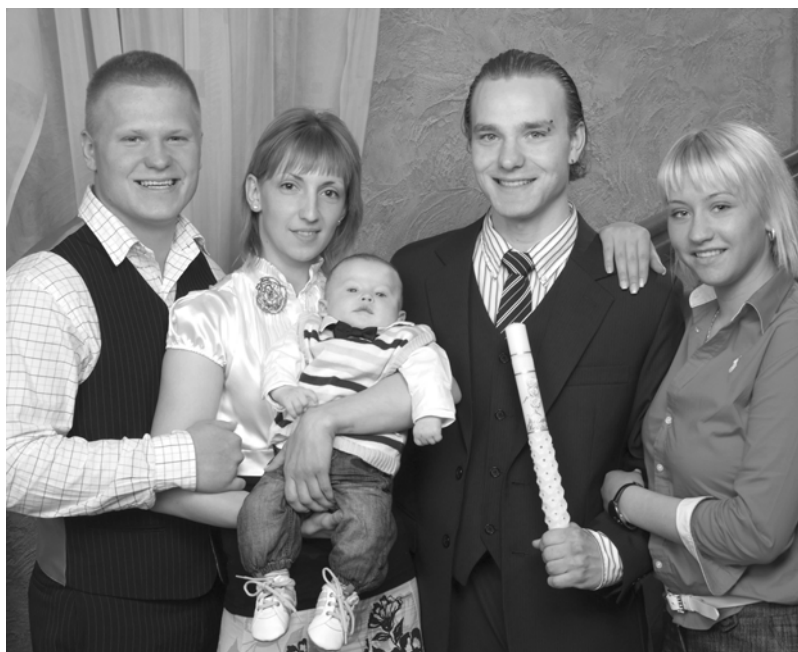
Denisek z rodzicami i chrzestnymi