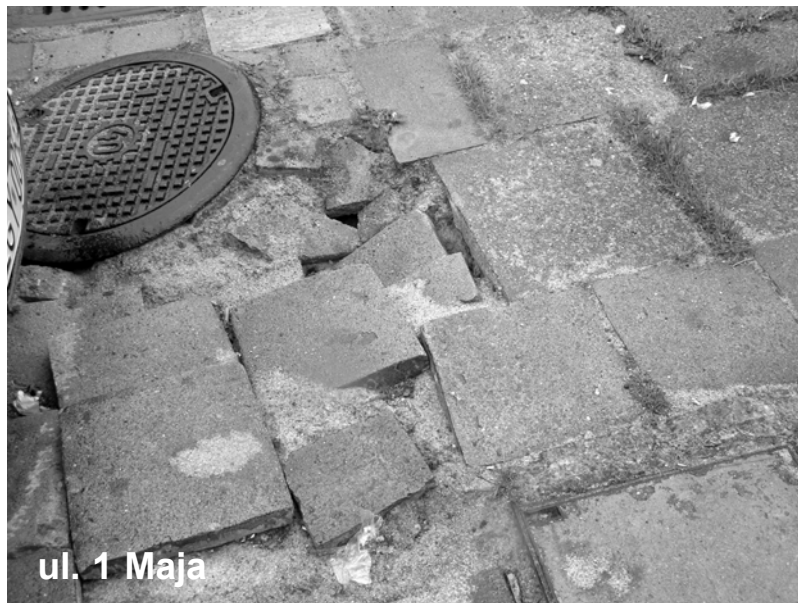
ul. 1 Maja

Płotach, jak na razie popadającym w ruinę. Ale wracamy do cudu na brukowych ulicach. Tak się bractwo w pracach zapędziło, że zupełnie zapomniało, że w Gryficach jest jeszcze np. ul. Sportowa, gdzie od nr 5 w górę do stadionu i za nim dziury w nawierzchni popychają dziury. A przecież na stanie Zarządu Dróg Powiatowych jest taka maszyna - remonter, dla której zalanie asfaltem czy zaklajstrowanie czymś podob-