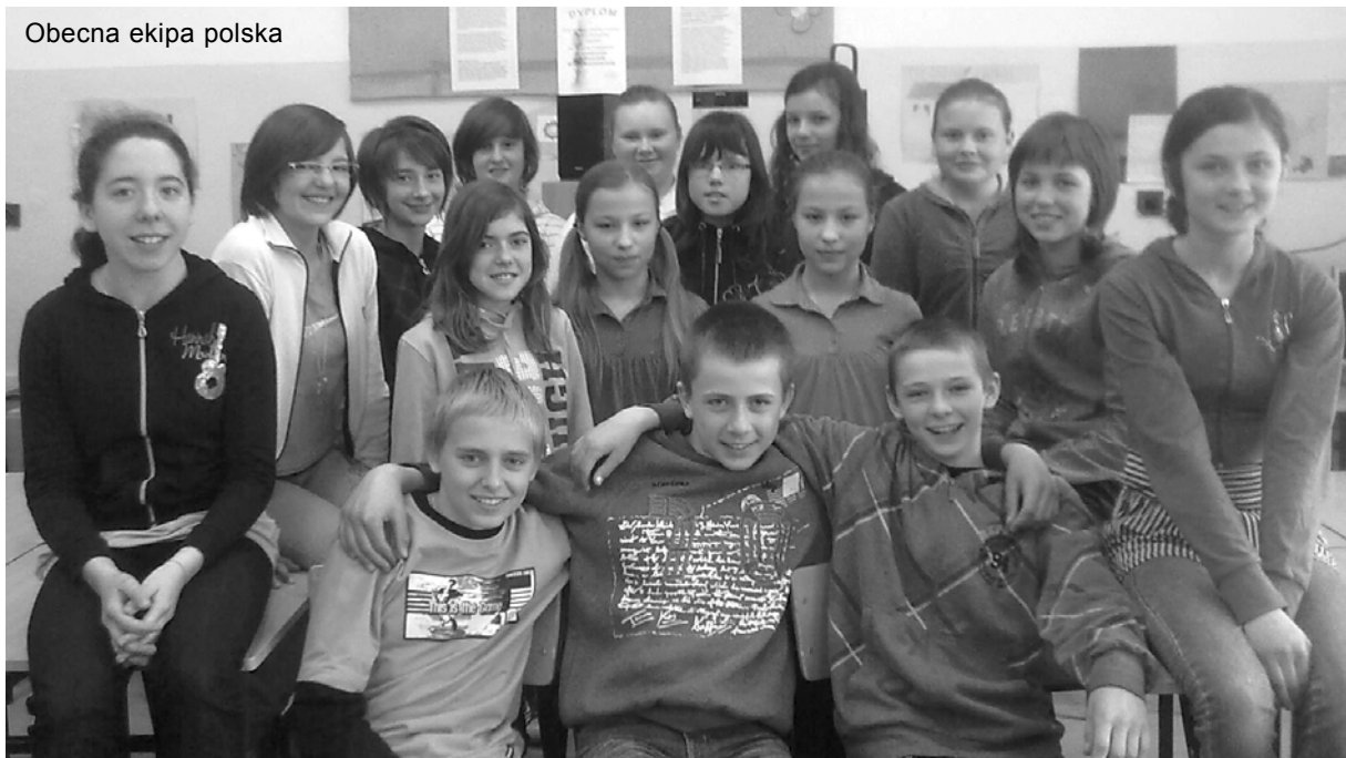
Obecna ekipa polska

dencyjny Klub Przyjaźni Polsko – Szwedzkiej), który w tym roku obchodzi dziesiątą rocznicę swoich „urodzin”.