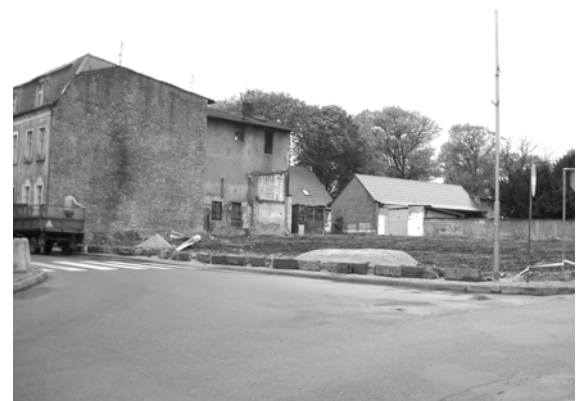
Pusty plac po budynku przy ul. Sikorskiego

Wypowiedź krótka, bo i ulica Krótka... M.