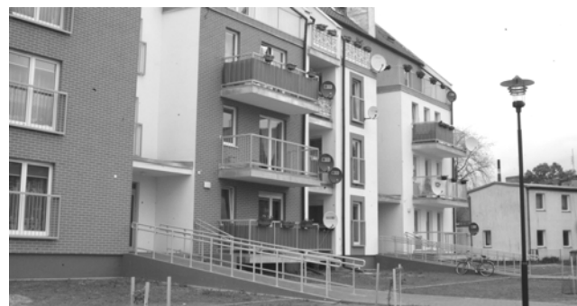
Nowe mieszkania przy ul. Gdyńskiej 11, przy skrzyżowaniu z ul. Krótką.

na o warunki w nowym domu, odpowiedziała: - Nie mam na co narzekać. Prąd jest, woda ciepła jest, toaleta też, w domu ciepło. I co najważniejsze, nie ma pieca, w którym cały czas trzeba było palić, żeby było ciepło.