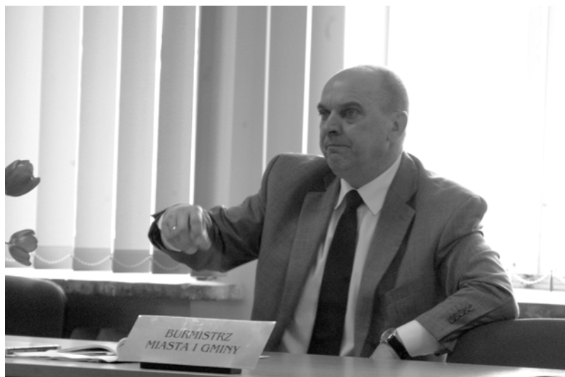
Temat zamykania szkół dopadł i tego burmistrza.

– Jeśli proces ten będzie postępował, trzeba będzie podjąć działania mające na celu zamknięcie nie-