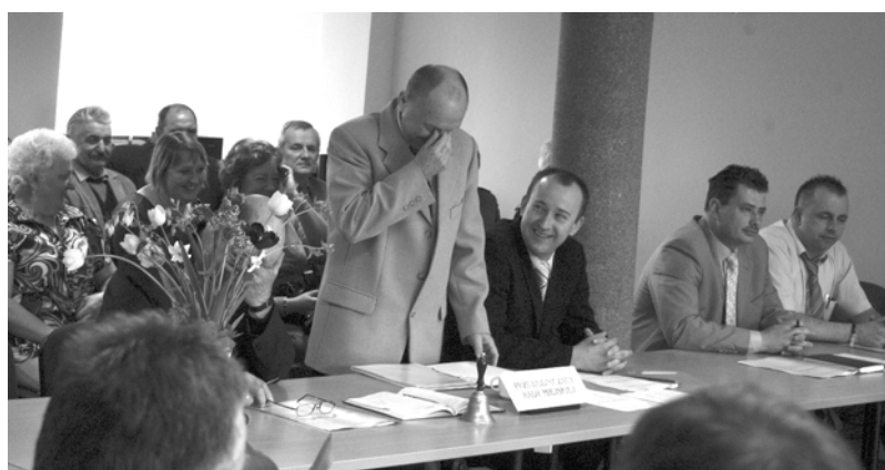
Choć interpelacji radni nie mieli, humor dopisywał od początku obrad.