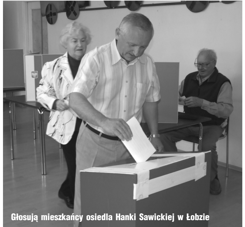
Głosują mieszkańcy osiedla Hanka Sawickiej w Łobzie

W gminie na 11503 uprawnionych do głosowania wydano 5348 kart, z czego ważnych głosów było 5318 (frekwencja - 46,49 %)