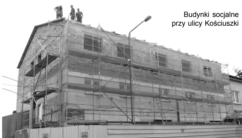
Budynki socjalne przy ulicy Kościuszki

W około 60 procentach są zaawansowane prace przy budowie ulicy Łąkowej. Prace przebiegają pomyślnie, a termin ich zakończenia wyznaczono na 30 września. Ta inwestycja będzie kosztowała ponad 1 milion złotych, z czego połowę zapłaci gmina miejska Świdwin, a pozostałe 50 procent jest sfinansowane z „Narodowego Programu Przebudowy Dróg Lokalnych 2008