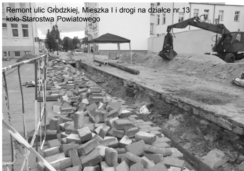
Remont ulic Grodzkiej, Mieszka I i drogi na działce nr 13 koło Starostwa Powiatowego