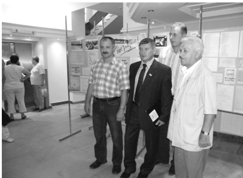
Dzia³acze na wystawie w „Gryfie”