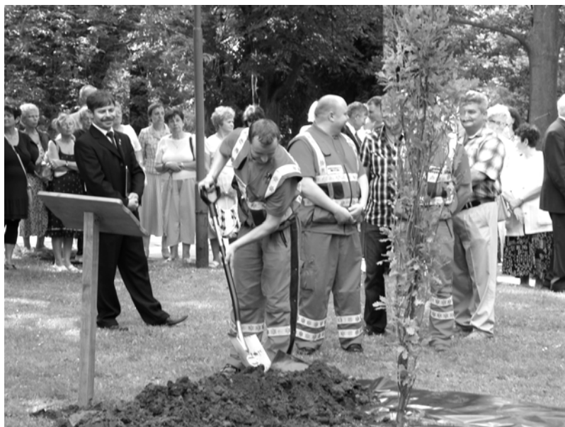
Sadzenie dêbu Solidarnoci