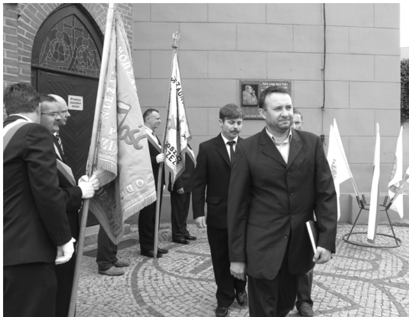
Sk³adanie kwiatów przed tablic¹ na koœciele