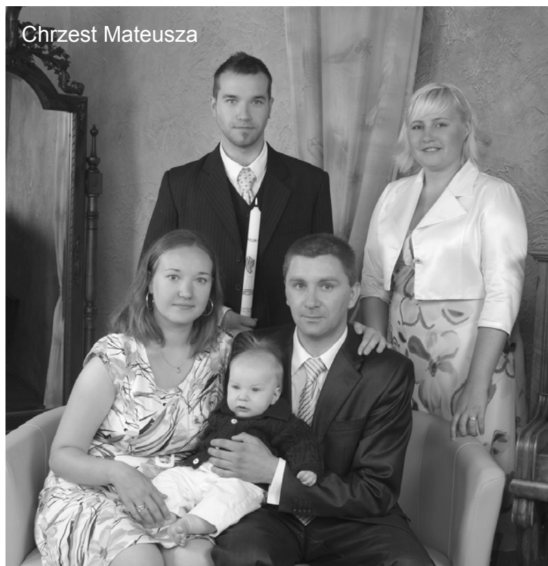
Foto-Video "Krzyś" s.c. w Łobzie Renata i Marek Pyrczak tel. 091/3974184 www.fotopyrczak.pl

Studio Foto-Klif Fotografowanie-Wideofilmowanie Edward Lipa- Resko-Dom Kultury. Tel.0508285242.