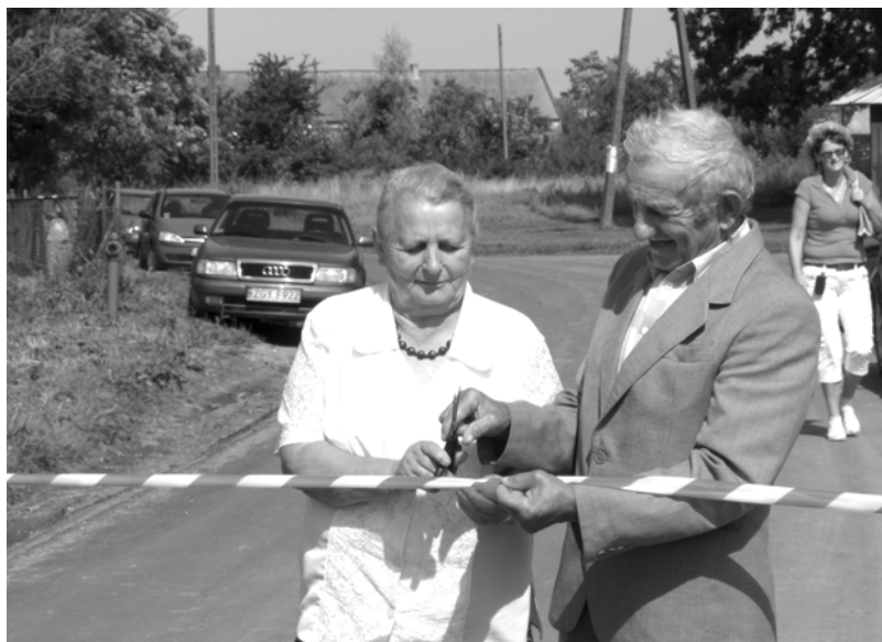
Mieszkańcy sami sobie otwierają drogę

Gazeta Gryficka (wydawca: Wydawnictwo Polska Prasa Pomorska w Łobzie).