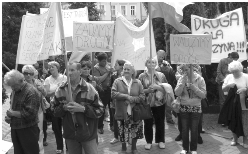
Protest przed starostwem w Gryficach w czerwcu br.

Bieczyno, 21 sierpień, godz. 14.00. Zgromadzenie mieszkańców przy świetlicy wiejskiej. Dzień bardzo uroczysty, kamery telewizyjne, dziennikarze, widoczna radość na twarzach ludzi. Mają co świętować, bo dziś otwierają drogę, o którą walczyli od dwóch lat, najpierw protestując przed Urzędem Miejskim w Trzebiatowie, później przed Staro-