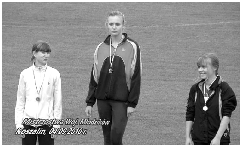
Mistrzostwa Woj. Młodzików Koszalin, 04.09.2010 r.

Wojewódzka Olimpiada Młodzieży w Lekkiej Atletyce, którą rozgrywano na początku września w Koszalinie, zgromadziła na starcie blisko 500 zawodniczek i zawodników województwa zachodniopomorskiego.