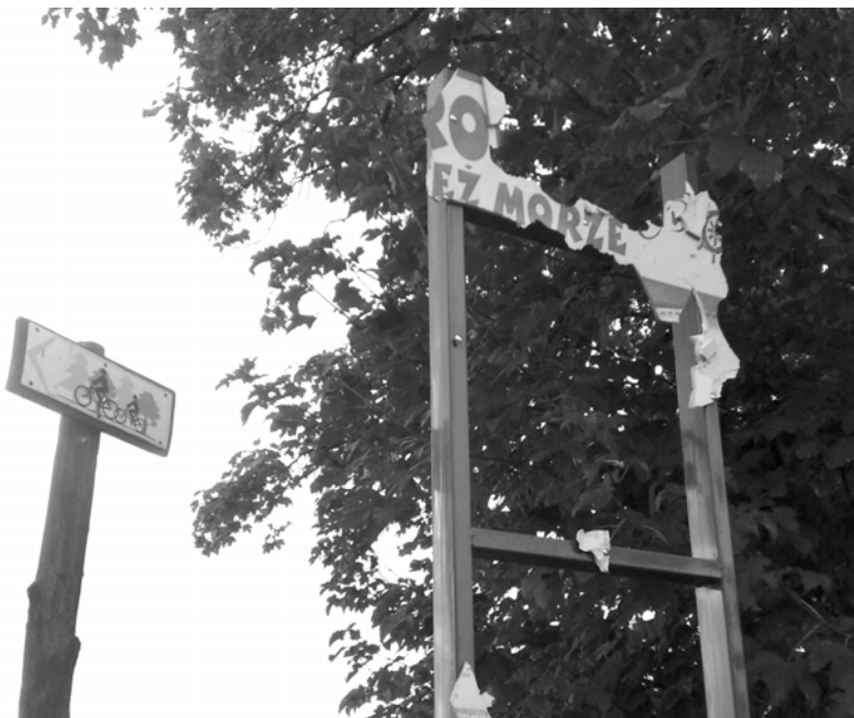
Przygnębiający widok inwestycji starostwa. Czy tak skończą kolejne?

Z turystycznym pozdrowieniem Grzegorz BURCZA