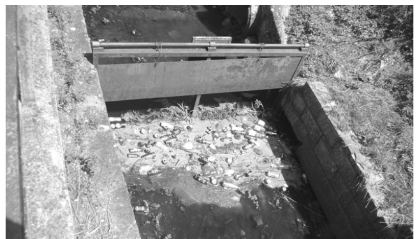
Łącznik ul. Dworcowej i Kolejowej i płynąca przy nim rzeczka, prosto do Regi, niewielki zator.