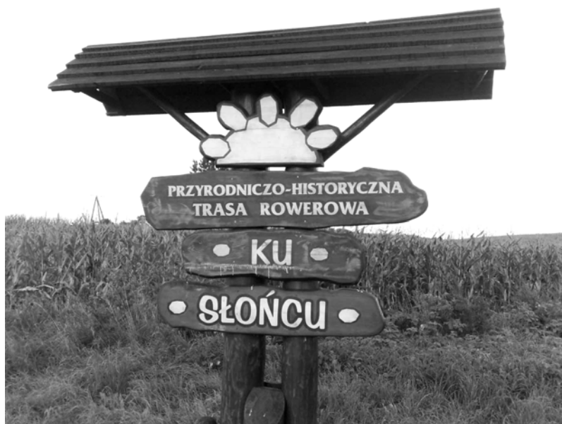
Fragment opisu trasy rowerowej Powiatu Kołobrzeskiego.