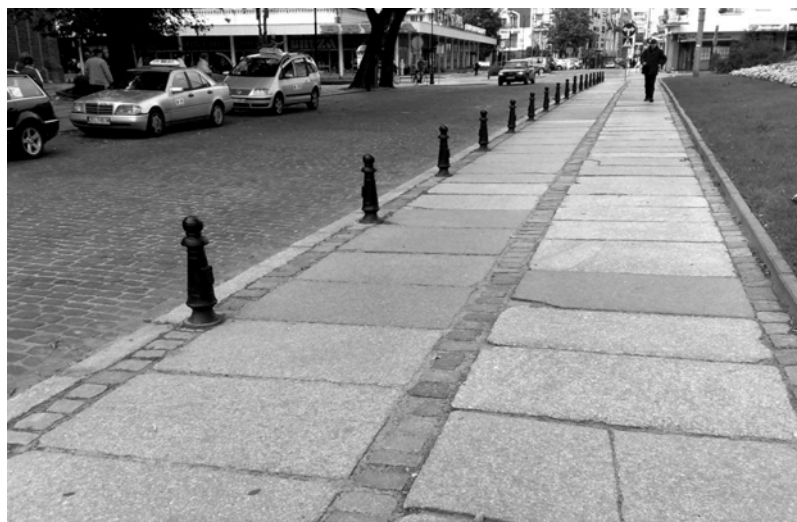
Fragment bezkolizyjnego połączenia drogi z chodnikiem w pobliskim Kołobrzegu.