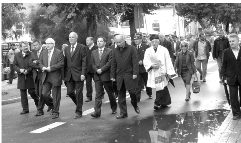
Manifestanci omijają stojącą kałużę na ulicy. Na codzień auta rozbrzdują wodę na przejściach. Gryficka norma.