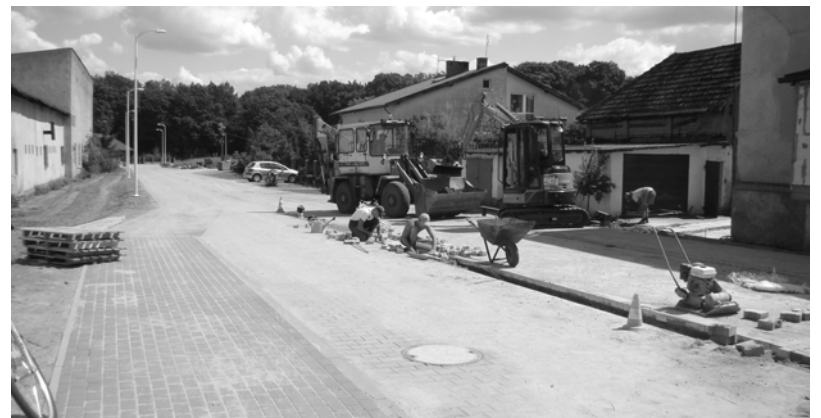
Ul. Parkowa, boczna od ul. Wojska Polskiego, drogi krajowej, było nie było, tu praca wre, ale przy niej mieszka „arystokracja”.