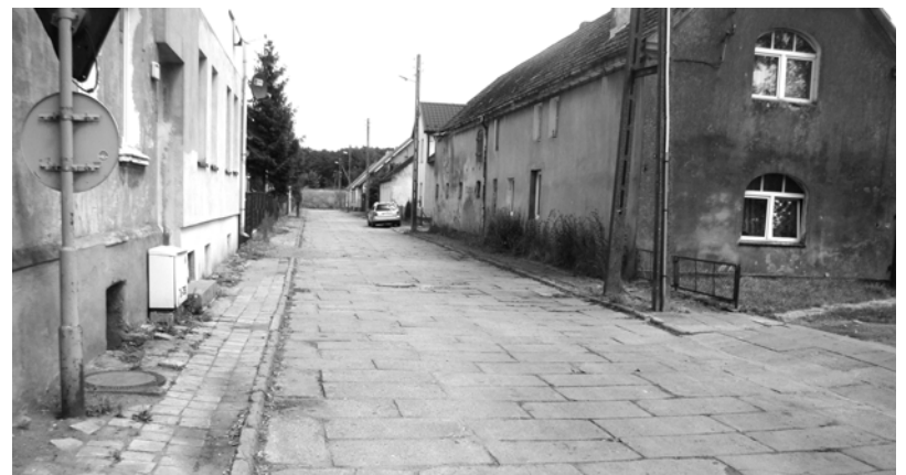
Ul. Rejtana, boczna od ul. Dworcowej, wojewódzkiej 109-tki, liczne interwencje mieszkańców w władz miasta, a ostatnio około rok temu „Trybun Ludu” obiecał im interwencję prasową, tyżącą modernizacji ulicy. Obiecać, obiecał, niestety bez echa do dzisiaj. Tu mieszkają mniej zamożni.