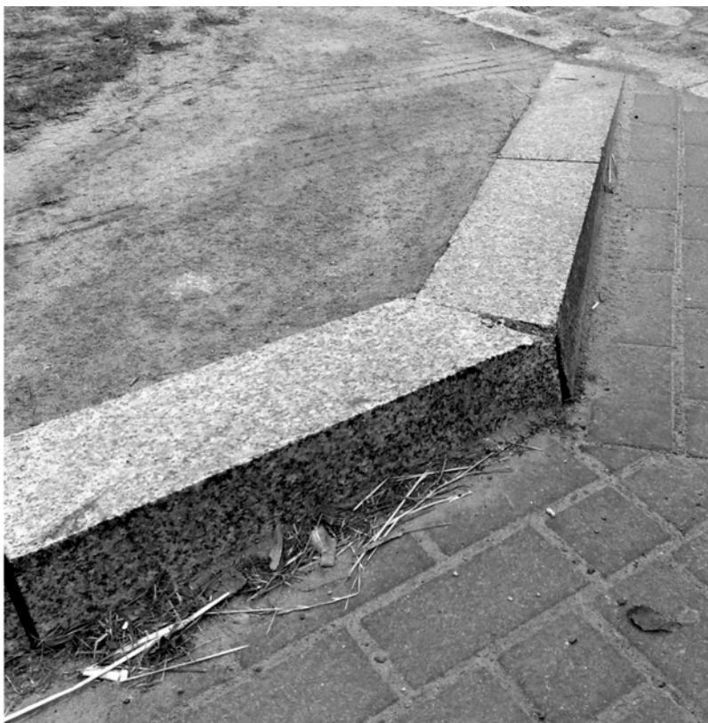
Tandetne i niebezpiecznie ostre krawężniki narażające użytkowników na szkody.