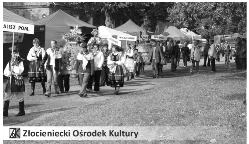
Złocieniecki Ośrodek Kultury