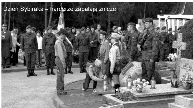
Dzień Sybiraka – harcerze zapalają znicze