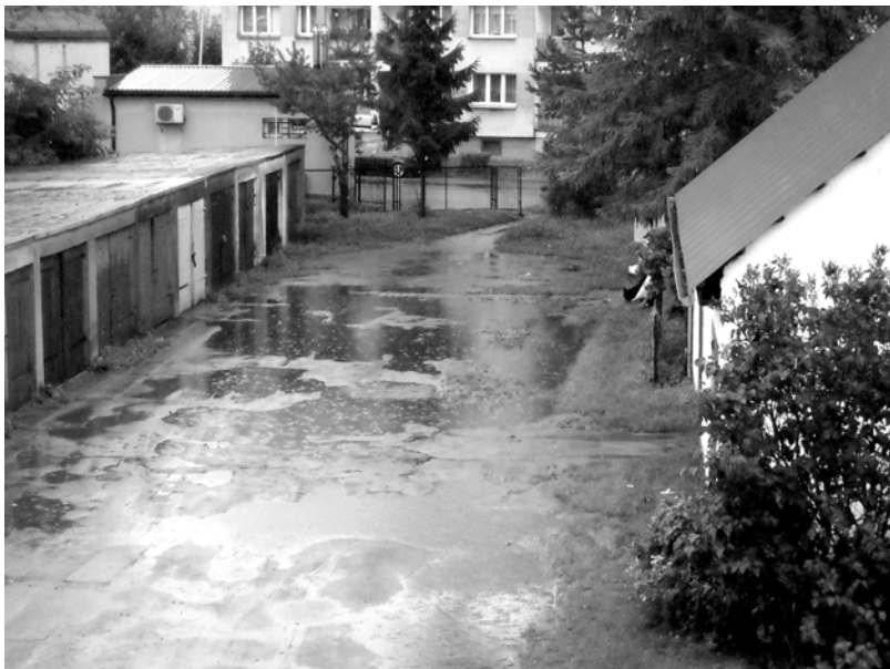
W czasie deszczu podwórko na Tkackiej niemal w całości zalane jest wodą.

(Złocieniec) Mieszkańcy ulicy Tkackiej nie mają łatwego życia. Ciężko na ulicę wjechać, jeszcze trudniej z niej wyjechać. Najprostsze czynności jak wyrzucenie śmieci czy drobne zakupy wcale nie muszą być tak proste, jak może się to wydawać. Tutaj niezależnie od pory roku bez kaloszy wykonać się tego nie da.