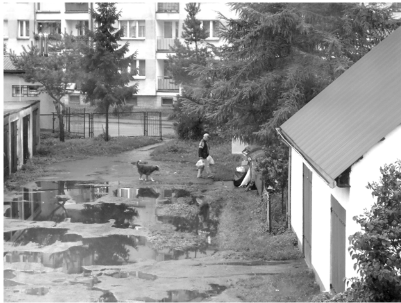
Kilka godzin później pierwszy odważny mieszkaniec wnosi śmieci.

kiej również nie jest łatwo. Wjazd na Czaplincekę zasłonięty jest bujnym żywopłotem, zza którego choćby się bardzo chciało, nie sposób dostrzec jadących pojazdów. – Tutaj jedzie się „na czuja”, najlepiej zamknąć oczy i cała naprzód. – żartuje jeden z mieszkańców. Wyjazd drugą stroną, przez ulicę Włókienniczą, również jest niemożliwy. Choć niedawno