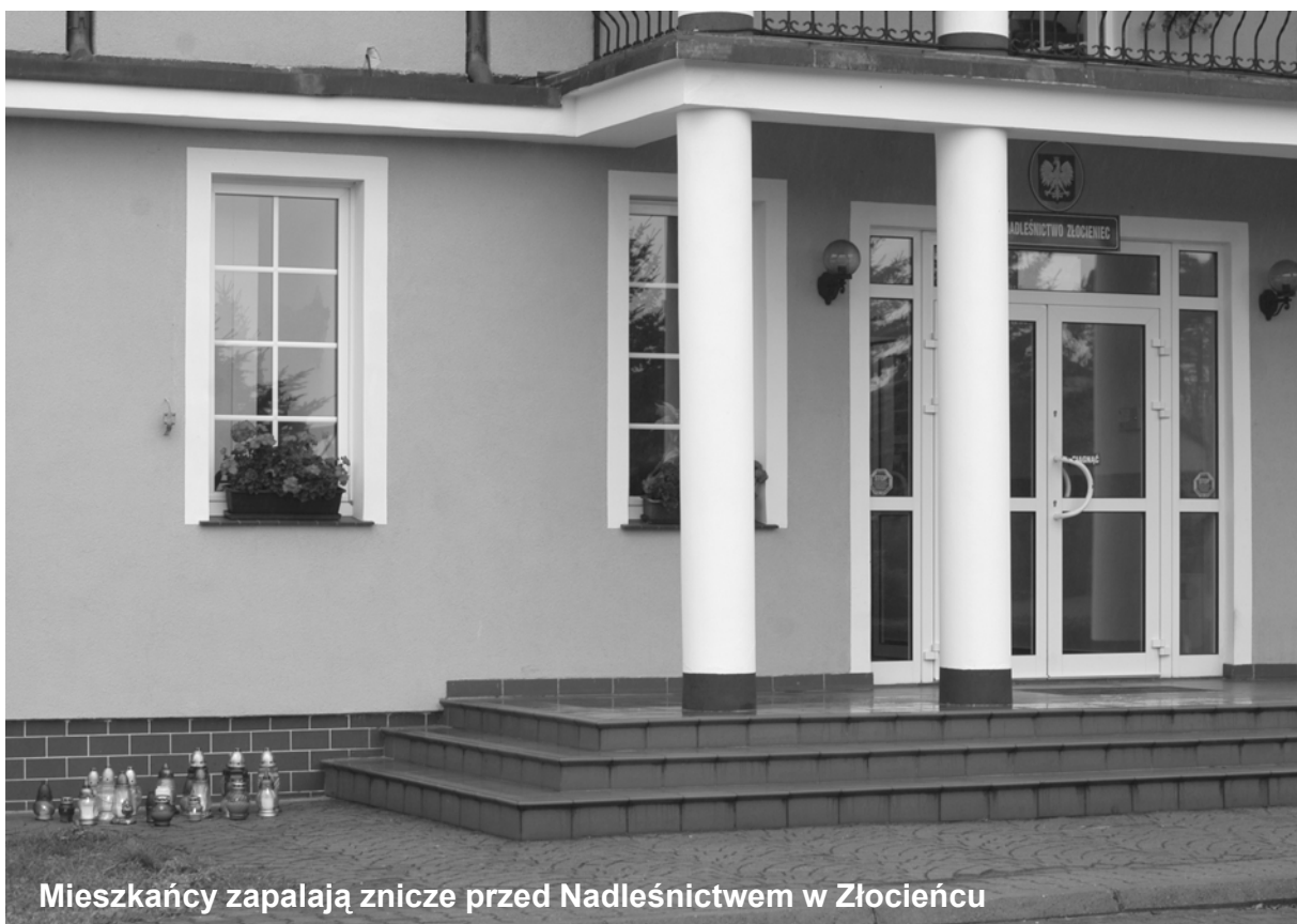
Mieszkańcy zapalają znicze przed Nadleśnictwem w Złocieniu

media wynika, że niemieccy ratownicy błyskawicznie znaleźli się na miejscu, a widok, jaki ujrzeli, był przerażający.