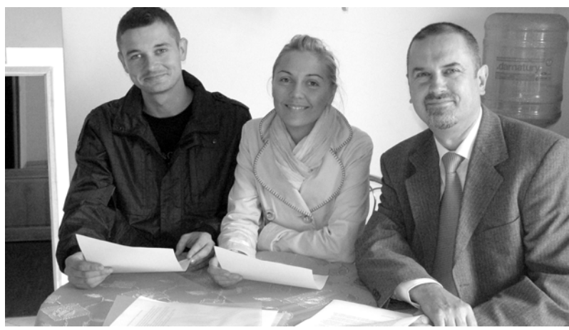
Platforma Obywatelska Województwa Zachodniopomorskiego Pan Stanisław Gawłowski Przewodniczący Regionu Pan Sławomir Nitras Przewodniczący Powiatu Szczecin