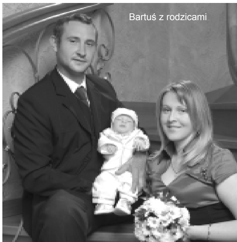
Bartuś z rodzicami