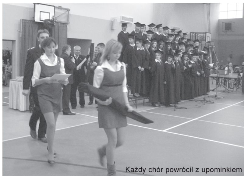
Każdy chór powrócił z upominkiem