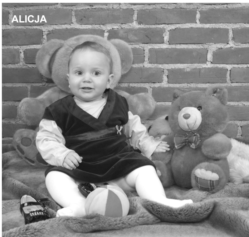
Foto-Video "Krzyś" s.c. w Łobzie Renata i Marek Pyrczak tel. 091/3974184 www.fotopyrczak.pl